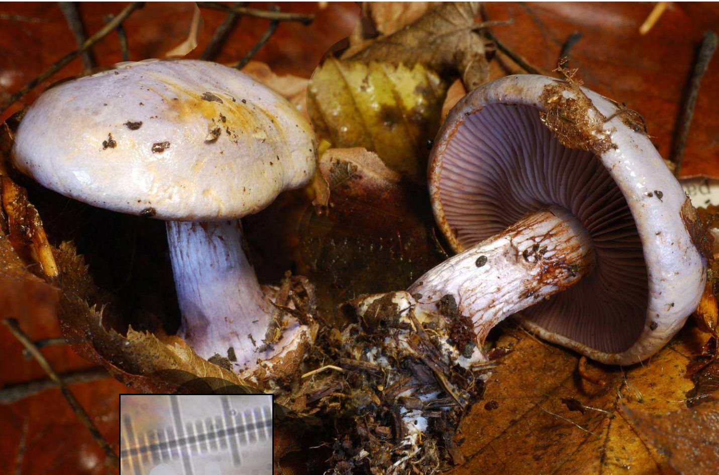
Leg. & det. JCV